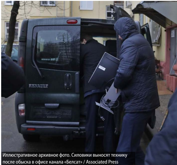
Иллюстративное архивное фото. Силовики выносят технику после обыска в офисе канала «Белсат»

в рамках так называемой спецоперации по установлению участников деструктивных чатов.