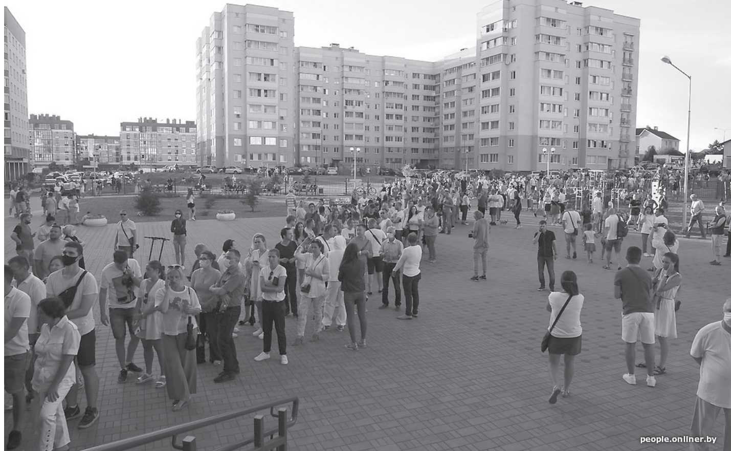
Таких очередей, как к избирательным участкам №70 и №71 в Минске, никто никогда не видел.