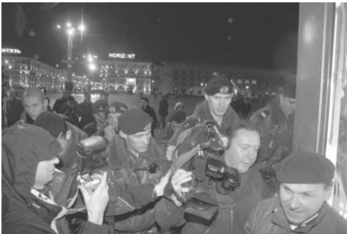
«Умение слушать активно, стимулируя собеседника — важная составляющая удачного интервью»

— направляющие. Эти вопросы служат для корректировки хода беседы, ее переключения в нужном для журналиста направлении. Для их применения важно умение импровизировать, мыслить ассоциативно. Опыт подсказывает, что нет двух вещей, которые нельзя было бы связать третьей. Но не всегда «веревочка» появляется за те секунды, которые отпущены, например, в эфире. Иногда помогает использование