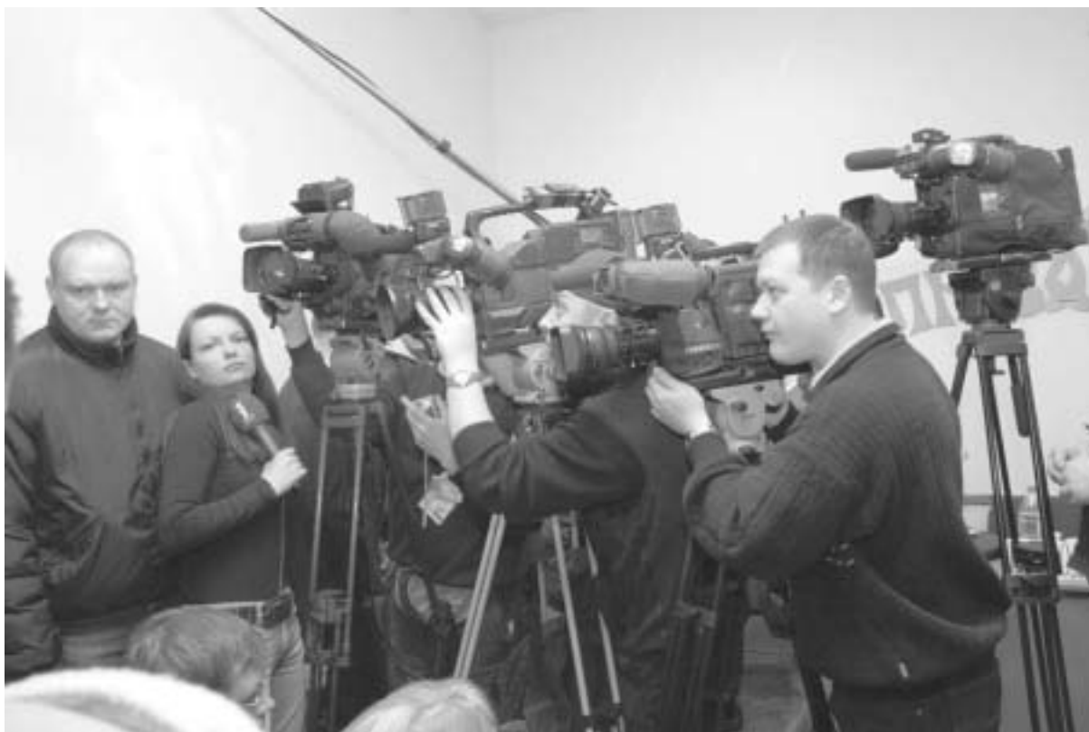
Штогод ля мікрафонаў і тэлекамэр памнажаецца колькасць спецыялістаў

Адзіным выйсьцем для тых, хто жадаў бы атрымаць дадатковыя веды па журналістыцы, стаў заснаваны ў Менску яшчэ ў 1997 годзе «Беларускі калегіум». Ён паўстаў з ініцыятывы шэрагу няўрадавых беларускіх арганізацыяў і прыватных асобаў як адукацыйны праект, у тым ліку і ў