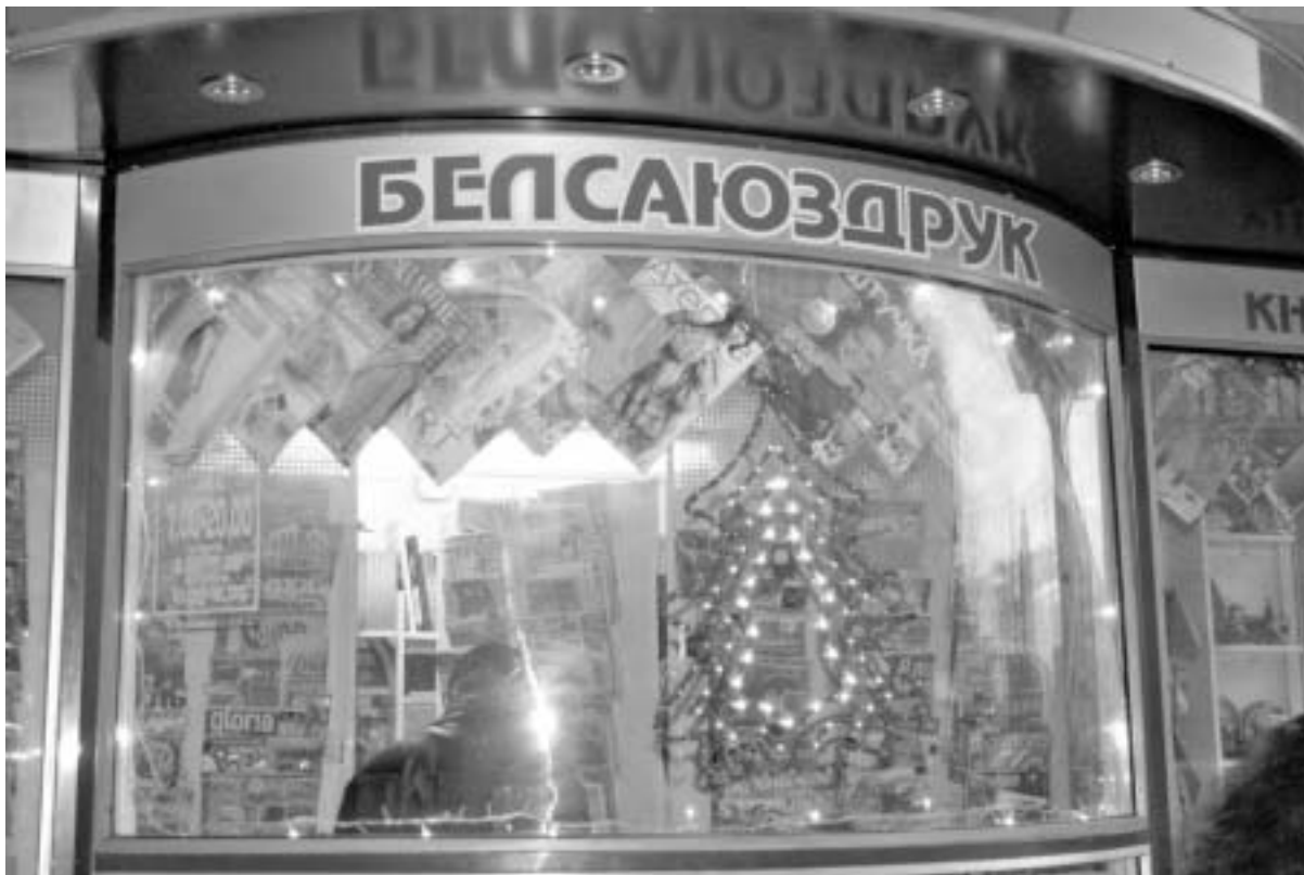
И чего здесь только нет! Нет — независимой актуальной прессы

ответа на письма трудящихся. «Управление облисполкома по культуре» такого безобразия по отношению к народу не допустило бы. Пришлось через два месяца (2 февраля 2007 года) направлять в это, не народное «управление культуры» повторное обращение с напоминанием о грубейшем нарушении Закона.