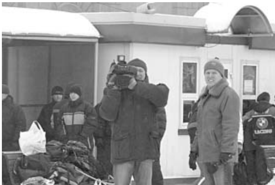
Наследия на отечественном ТВ практически не осталось?

— Хочу продолжить новый поворот этой темы: может ли