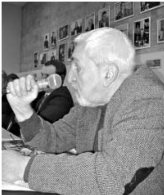
Прэзідэнт Расійскага фонду абароны галоснасці А. Сіманаў занепакоены забойствамі журналістаў

Расійскія СМІ шырока прадстаўлены ў нашай інфармацыйнай прасторы. Але з упэўненасцю можна сказаць, што іх прысутнасць тут ніякім чынам не вырашае асноўнай праблемы — забеспячэння нашага грамадства незалежнай, неангажаванай інфармацыяй пра ўнутраныя падзеі. Абсалютна канкрэтны прыклад: энергетычнае супрацьстаянне паміж Беларуссю і Расіяй, сведкамі якога мы былі зусім нядаўна. Гэта менавіта тая сітуа-