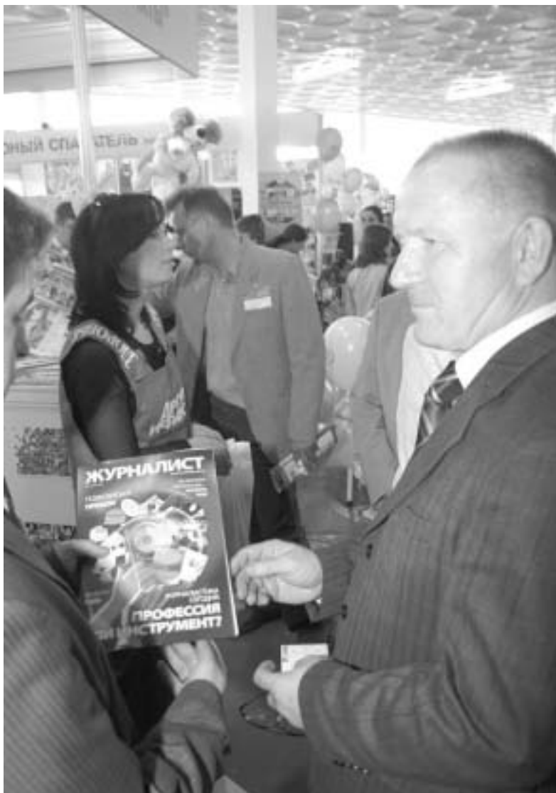
Міністар і «журналіст»

Прыкладам можа быць Нямеччына, дзе існуе некалькі шляхоў набыцьця журналісцкай адукацыі: навучаньне ва ўнівэрсытэце, у журналісцкай школе ці так званы валантэрыят. Адрозьнічваючы ад заканчэньня гімназіі можна паступіць ва ўнівэрсытэт на спэцыяльнасьці «мэдыя й камунікацыі» ці «публіцыстыка». Навучаньне ў журналісцкай школе зьяўляецца самым