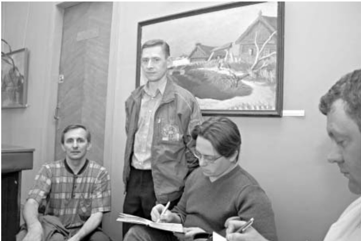
«Навука» ад калег — ці ня самая дзейсная

вед, і ёй лягчэй. Не бяда, што ўсё было па-расейску. Галоўнае — жаданьне выкладаць свой прадмет на роднай мове!» Але, на жаль, такіх выкладчыкаў значна менш, чым тых, хто проста зарабляе грошы, адпрацоўваючы гадзіны ва ўнівэрсытэце. Тым самым яны паказваюць студэнтам, што можна «адседзецца» й атрымаць тое ж, што й той, хто ўкладае душу, каб дасягнуць добрага выніку. Вось і выходзіць, што ўсё залежыць толькі ад уласнага жаданьня маладзёнаў атрымаць веды. Аднак праблема яшчэ і ў тым, што студэнты беларускіх ВНУ настолькі загрузаныя ўся-