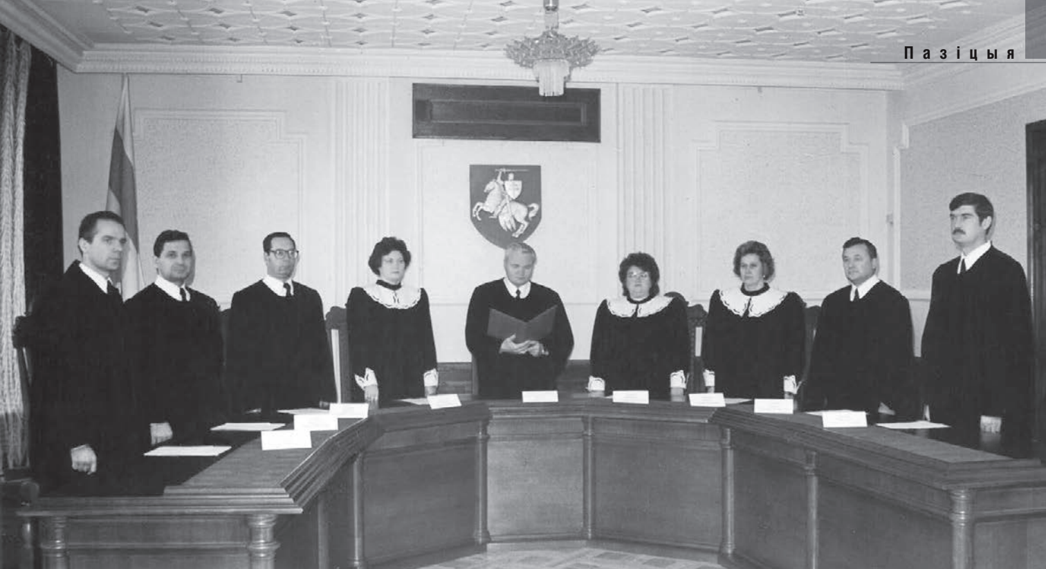
Первый состав Конституционного Суда