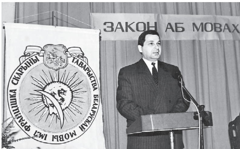
Першы выступ на беларускай мове (на канферэнцыі, прысвечанай 10-годдзю Закона аб мовах)

стораница в истории Конституционного суда, который не выполнил свою обязанность по защите Конституции и уклонился от принятия принципиального решения по этому делу.