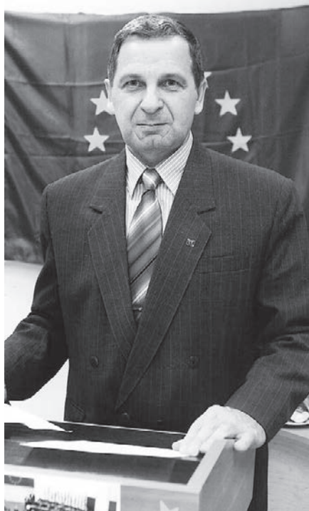
Моя работа — преподаватель