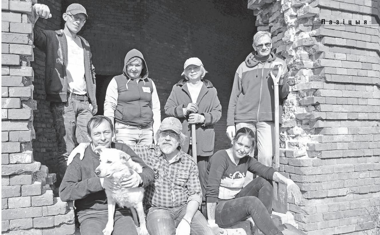
У верасні 2017-га сябры БАЖ правялі прыборку ў Бабруйскай крэпасці.

— Як Вы лічыце, што і хто мусіць зрабіць, каб тыя абсурдныя гісторыі, што Вы апісваеце ў рамане, так і заставаліся ў кнізе, а не былі сумнавядомымі амаль кожнаму журналісту незалежных выданняў з практыкі?