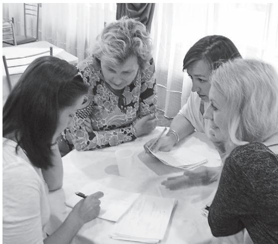
Участники курса выполняют задание

Медиация служит для того, чтобы разрешать конфликтные ситуации. А для журналистов конфликт — это хлеб.