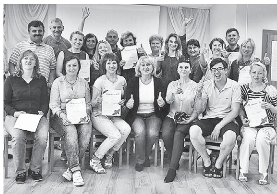
Участники летней школы медиации

курс медиации при Белгосуниверситете и получила Свидетельство медиатора Министерства юстиции.