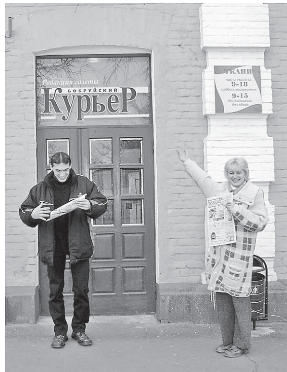
Гэтак было ў 2003 годзе

Сайт babruysk.by пачаў працу ў чэрвені 1998 года, калі больш за палову чытачоў нават кампутара яшчэ не мелі дома.