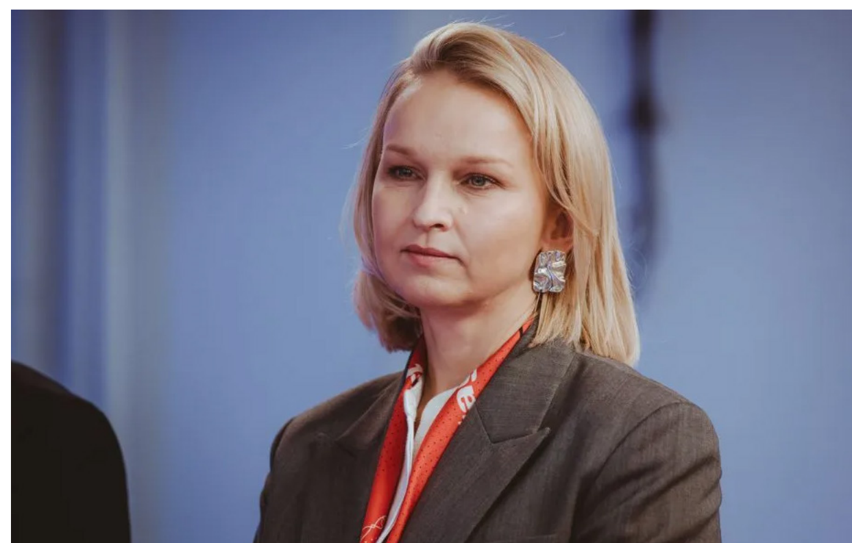
Алина Ковшик.

Комитет государственной безопасности Беларуси включил главу телеканала «Белсат» Алину Ковшик в «перечень организаций и лиц, причастных к террористической деятельности». Это связано с тем, что 9 июля 2025